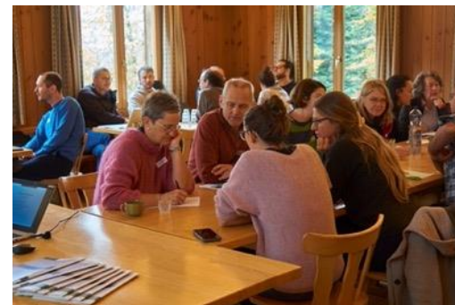
Jahrestagung der AG WaPlaMa vom 9. November, Foto: Lea Flükiger