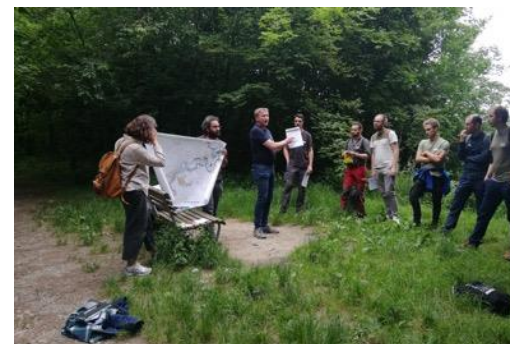
Fowala Seminar der AG WaPlaMa vom 20. Juni, Foto: Lea Flükiger