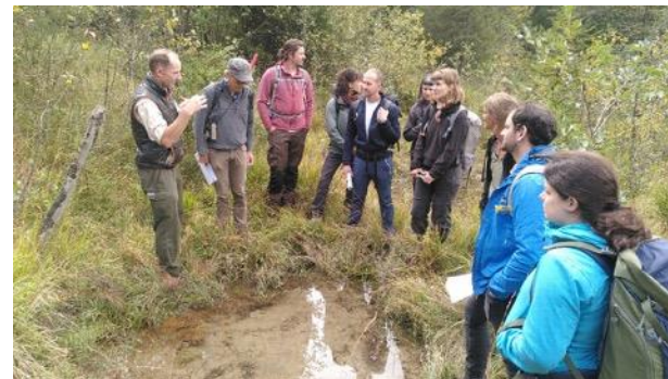
Colloque pratique 3-4 octobre 2023