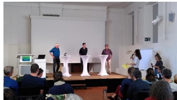
Colloque spécialisé 28 mai 2024